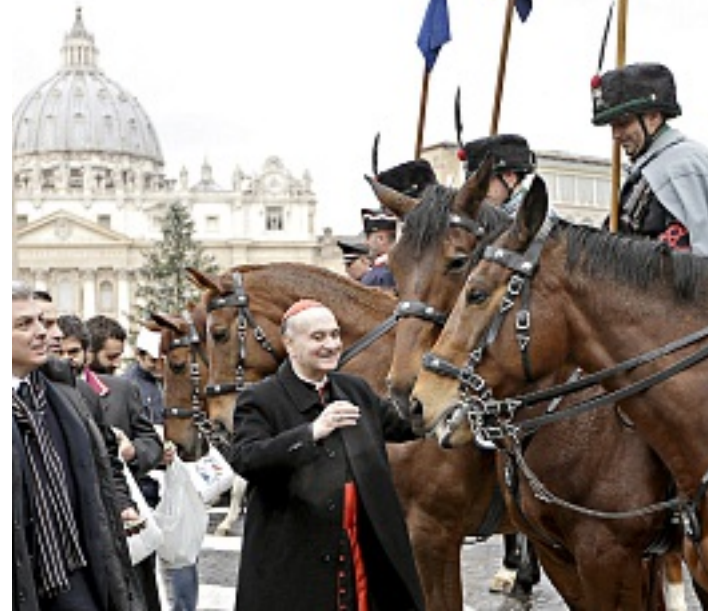
► El Cardenal Gianfranco Ravasi, presidente del Consejo Pontificio de la Cultura, dará una charla en la UDEM el 8 de mayo.

El tema principal será “San Francisco de Asís y el Arte Sacro del Trecento”, que busca mostrar el dolor del hombre de la actuali-